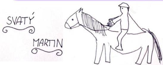
Autorka Adéla P., 4. A